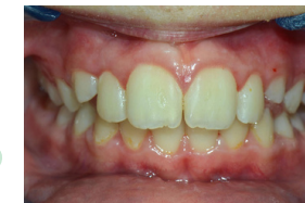
6 hónap után