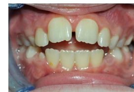
8 éves - kiindulási állapot